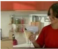
Comment fabriquer une éolienne? (Catégorie fiche numérique Sankoré)