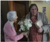
La tête en friche (Catégorie cinéma dans la classe)