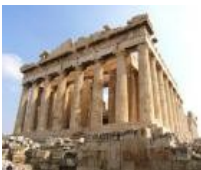
Crise de la dette grecque (Catégorie langue de spécialité)