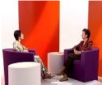
Femme et travail (Catégorie fiche classique)

Exemples des fiches pédagogiques accessibles sur le site « franciaoktatas.eu » Cliquez sur le lien.